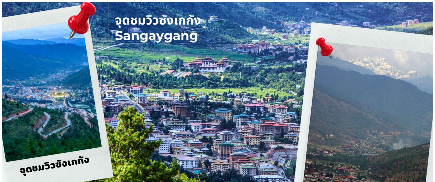
จุดชมวิวซังเกกัง Sangaygang

นำท่านชม จุดชมวิวซังเกกัง (Sangaygang) จุดชมวิวทิวทัศน์ที่สวยงามของหุบเขาเมืองทิมพู เพื่อเก็บภาพประทับใจ จากนั้นนำทุกท่านเดินทางสู่เมืองพาโร ใช้เวลาประมาณ 1 ชั่วโมง