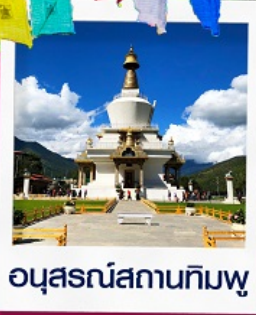
อนุสรณ์สถานทิมพู

พีชิตยอดเขา วัดทักซัง วิหารศักดิ์สิทธิ์ของชาวพุทธ เที่ยวครบ พาโร ทิมพู พูนาคา 5วัน 4คืน