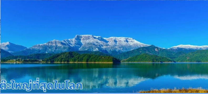
ภูเขาหิมะวางู๋ ภูเขาโต๊ะใหญ่ที่สุดในโลก