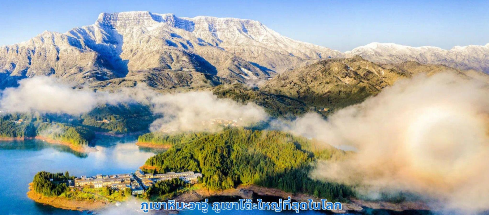
ภูเขาหิมะวางู๋ ภูเขาโต๊ะใหญ่ที่สุดในโลก