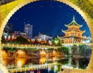
ตึกเซียวเฮยา