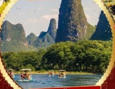
ล่องแพแม่น้ำหลีเจียง