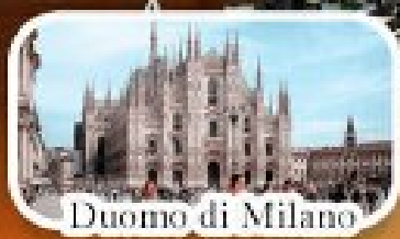
Duomo di Milano