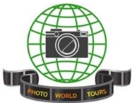
PHOTO WORLD TOURS