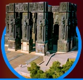
อนุสาวรีย์ประวัติศาสตร์

48,888 23-28 ต.ค. 67 เหลือ 10 ที่ 41,111