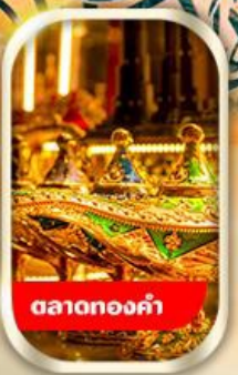
ตลาดทองคำ