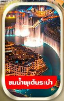
ชมน้ำพุต้นระบำ

นั่งรถ 4WD ชมทะเลทรายอาหรับ พร้อมทานดินเนอร์อาราเบีย