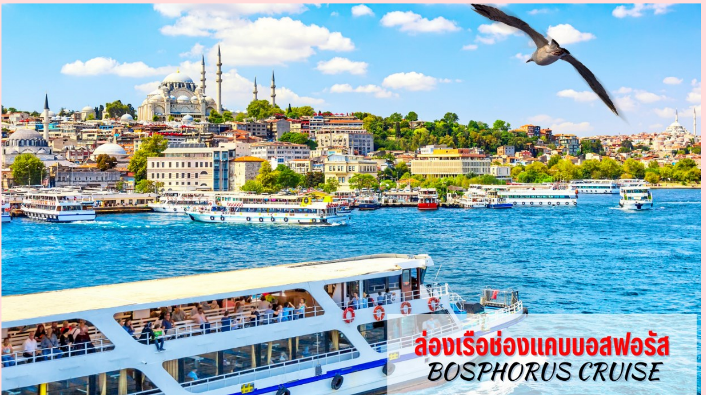
ล่องเรือชมช่องแคบบอสฟอรัส BOSPHORUS CRUISE

นำท่าน ล่องเรือชมช่องแคบบอสฟอรัส (Bosphorus Cruise) ช่องแคบที่เชื่อมทะเลดำ (The Black Sea) ทะเลมาร์มา (Sea Of Marmara) มีความยาวประมาณ 32 กม. ความกว้างตั้งแต่ 500 เมตรจนถึง 3 กิโลเมตร ซึ่งถือว่าเป็นที่สุดของยุโรปและเอเชียมาพบกันที่นี่นอกจากความสวยงามแล้ว ช่องแคบบอสฟอรัสยังเป็นจุดยุทธศาสตร์ที่สำคัญยิ่งในการป้องกันประเทศตุรเคียอีกด้วย ขณะล่องเรือท่านจะได้เพลิดเพลินกับการชมทิวทัศน์ที่สวยงามทั้งสองข้างทางไม่ว่าจะเป็นพระราชวังโดลมาบาห์เซ่หรือบ้านเรือนสไตล์ยุโรปของบรรดาเศรษฐีตุรเคียและมีป้อมปืนตั้งเรียงราย