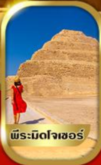
พีระมิดโจเซอร์