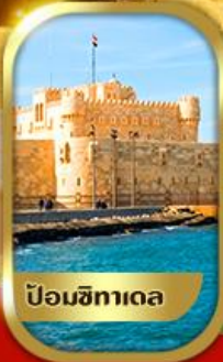
ป้อมซิทาเดอ