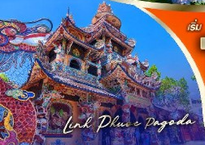
Linh Phuoc Pagoda