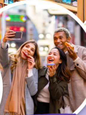
ตลาดเมียงดง