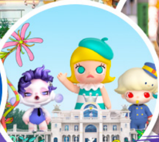
ช้อปบิง POP MART