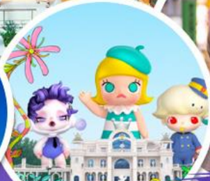
ซื้อบ๊ิง POP MART