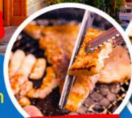
ต้มยำเกาหลี