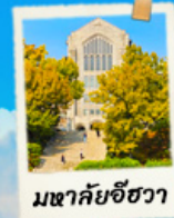
มหาวิทยาลัยฮวา