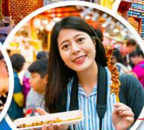
- ตลาดควางจั้ง