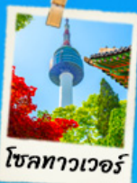
โซลทาวเวอร์