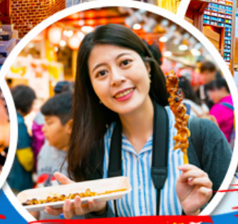
ตลาดควางจ้ง