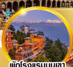
พักโรงแรมบนเขา ชมวิวหิมาลัยสุดฟิน