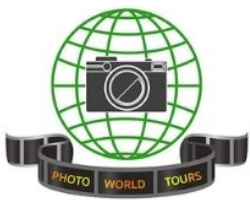
PHOTO WORLD TOURS