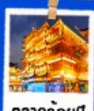
ตลาดร้อยปี