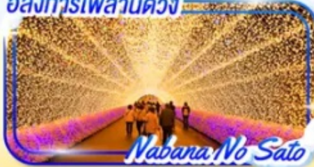
Nabana No Sato