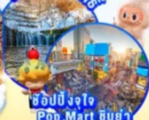
ช้อปปิ้งจ๊อ Pop Mart ชิบูย่า