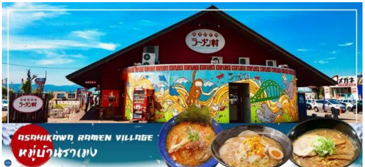
ASAHIKAWA RAMEN VILLAGE หมู่บ้านรามเอน

อิสระรับประทานอาหารกลางวัน ณ หมู่บ้านรามเอน