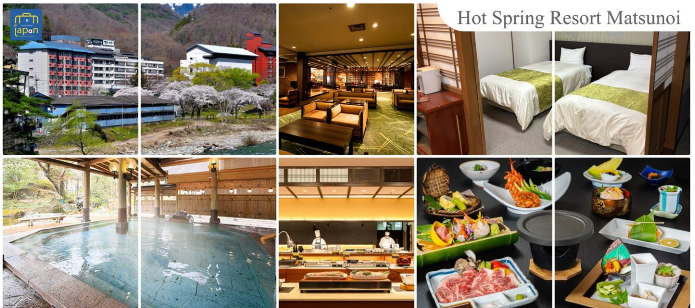
Hot Spring Resort Matsunoi

รับประทานอาหารค่ำ ณ ภัตตาคาร ของโรงแรม (5) --- บุฟเฟต์นานาชาติ หลังอาหารให้ท่านได้ผ่อนคลายกับการแช่น้ำแร่ธรรมชาติ เชื่อว่าถ้าได้แช่น้ำแร่แล้ว จะทำให้ ผิวพรรณสวยงามและช่วยให้ระบบหมุนเวียนโลหิตดีขึ้น