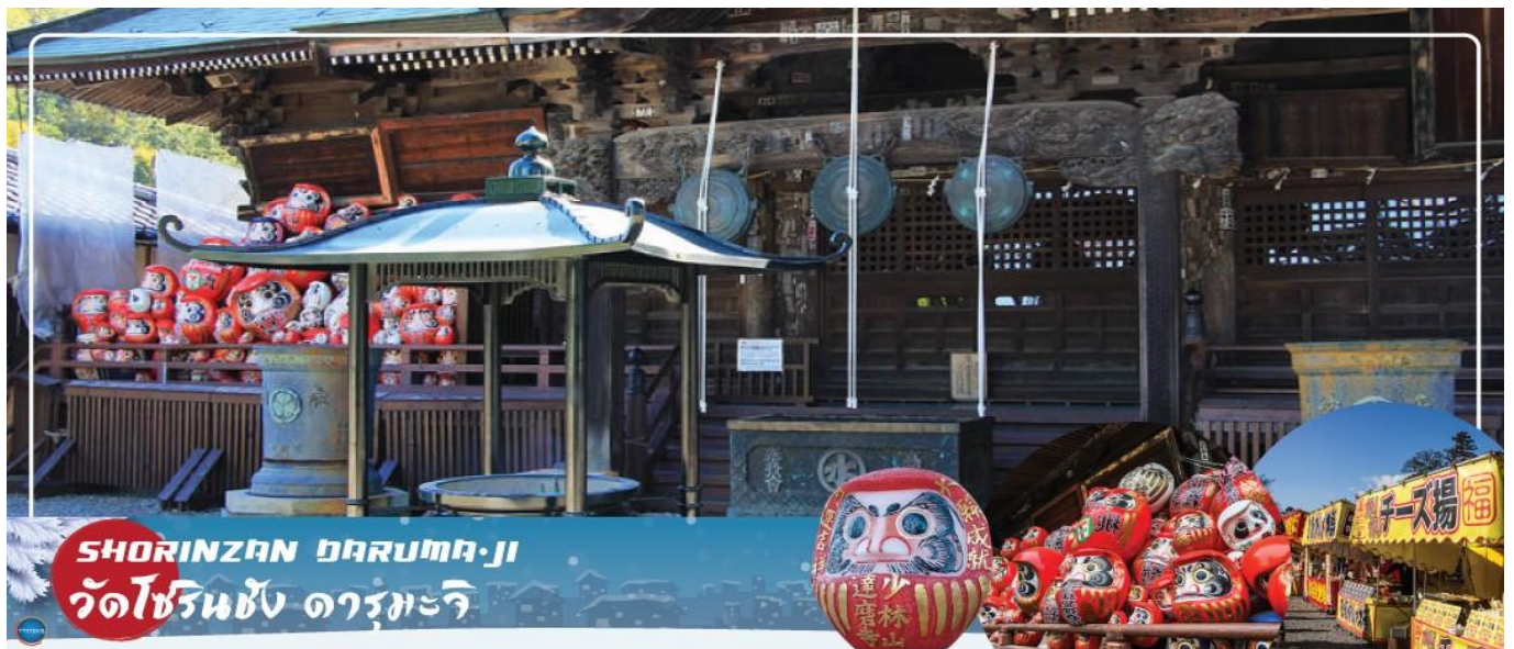
SHORINZAN DARUMA-JI วัดโชรินซัง ดารุมะจิ

เที่ยง อิสระรับประทานอาหารกลางวัน ณ ลานสกี กาล่ายูซาวา จากนั้นนำท่านเดินทางสู่เมือง ทาคาซากิ เพื่อเยี่ยมชม วัดโชรินซัง ดารุมะจิ (SHORINZAN DARUMA-JI) (ใช้เวลาเดินทางประมาณ 2 ชั่วโมง) วัดนี้สร้างขึ้นในปี 1697 และกล่าวกันว่าเป็นสถานที่ต้นกำเนิดตุ๊กตาดารุมะของญี่ปุ่น ตุ๊กตามีหมวดเครายอดนิยมนี้เป็นเครื่องรางนำโชค ตามธรรมเนียมแล้ว เมื่อท่านต้องการขอพรให้เต็มดวงตาข้างหนึ่งของตุ๊กตา และเมื่อพรที่ขอไว้เป็นจริง ค่อยเติมตาอีกข้างหนึ่ง แล้วพอถึงช่วงสิ้นปี ก็ให้นำตุ๊กตาดกลับมาเผาที่นี่ วัดแห่งนี้เต็มไปด้วยตุ๊กตาดารุมะที่มีขนาดและสีสรรหลากหลาย ซึ่งแต่ละที่ก็สื่อถึงความหมายแตกต่างกัน สีแดงเป็นสีที่พบบ่อยที่สุดและเป็นสีสำหรับนำโชคลาก โดยตุ๊กตาดารุมะที่นี้จะจะมีให้เราเลือกหลายสี หลายขนาดและราคา