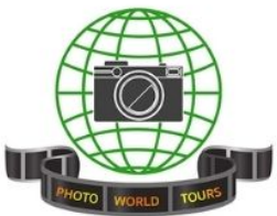
PHOTO WORLD TOURS