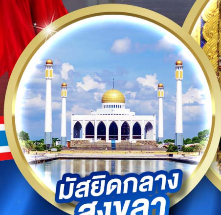
มัสยิดกลาง สงขลา