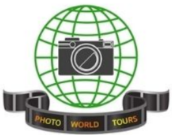
PHOTO WORLD TOURS