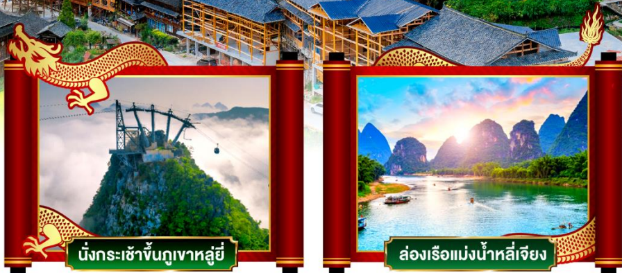
นั่งกระเช้าขึ้นภูเขาหลูอี้