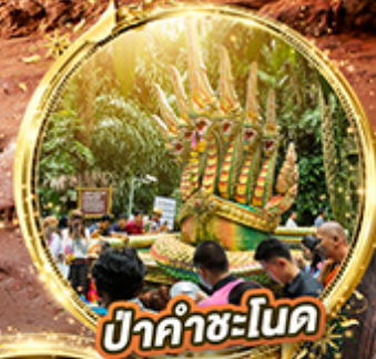
ปากำชะโนด