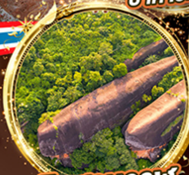
หินสามวาฬ