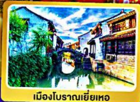
เมืองโบราณเหยี่ยวหอ