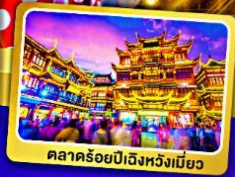
ตลาดร้อยปีเจิ้งหวังเมี่ยว