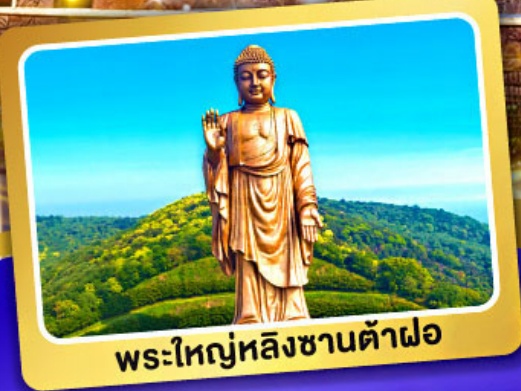
พระใหญ่หลิงซานต้าฝอ