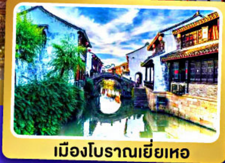
เมืองโบราณเยี่ยเหอ