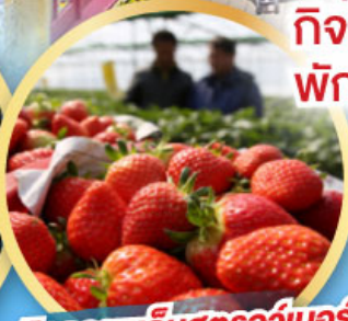
กิจกรรมเก็บสตอร์วเบอร์รี่