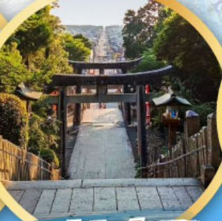
ศาลเจ้ามียาจิดากะ