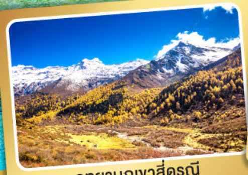
อุทยานภูเขาสั่ครุณี