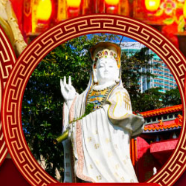
เจ้าแม่กวนอิม ร่ำพลัสเบย์