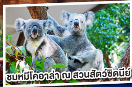
ชมหมีโคอาล่า ณ สวนสัตว์ซิดนีย์