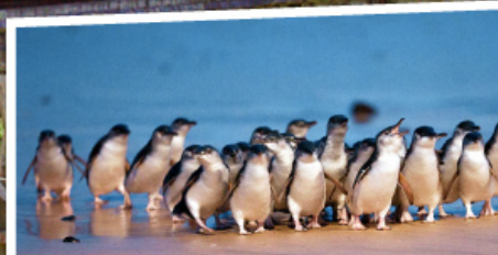
ชมความน่ารักตามธรรมชาติของ พวงเพนกวินพาทรด ณ เกาะฟิลลิป