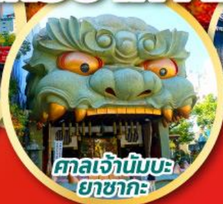
ศาลเจ้านันบะ ยาซากะ