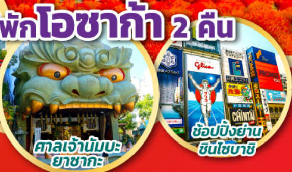
พักโอซาก้า 2 คืน