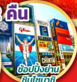
ช้อปปิ้งย่าน ชินโซบาชิ