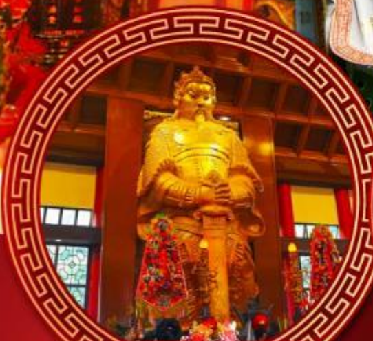
วัดเขกงหมิว