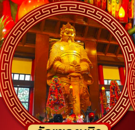
วัดเขกหมิว