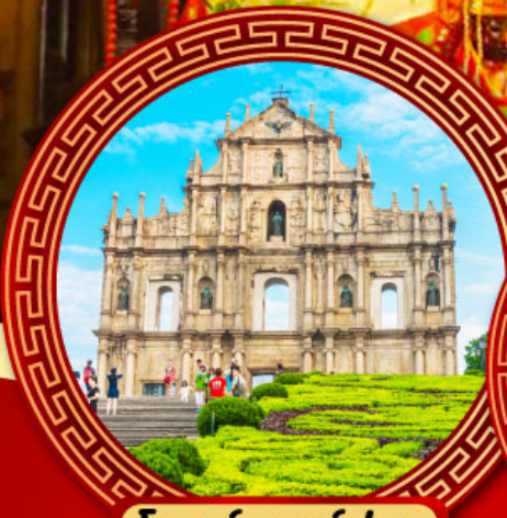
โบสถ์เซนต์ปอล