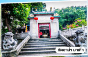
วัดอาปา มาเก๊า