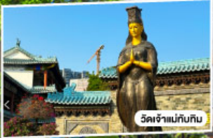
วัดเจ้าแม่กวนอิม