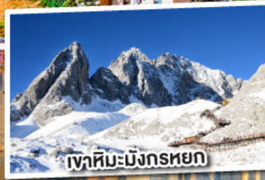
เขาสหิมะมังกรหยก