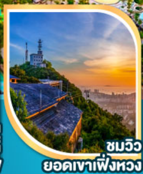
ชมวิว ยอดเขาเฟิงหวง