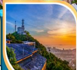
ชมวิว ยอดเขาเฟิงหวง