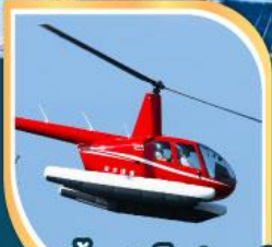
ขึ้นเฮลิคอปเตอร์ ชมวิว 360 องศา