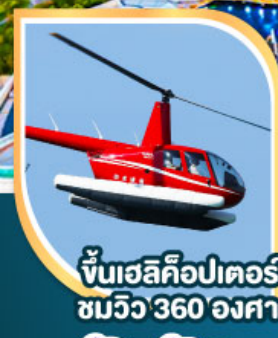
ขึ้นเฮลิคอปเตอร์ ชมวิว 360 องศา