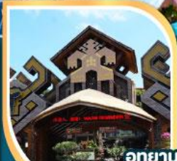
อุทยาน วัฒนธรรมเผ่าแม้ว-หลี กิจกรรมรอบกองไฟ