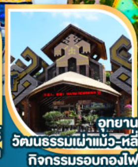
อุทยาน วัฒนธรรมเผ่าแม้ว-หลี กิจกรรมรถกอล์ฟ