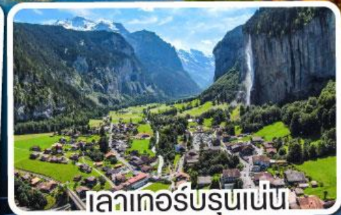
ลาเทอ์บรุนเนน