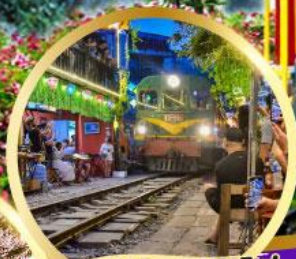
ร้านกาแฟรถไฟ