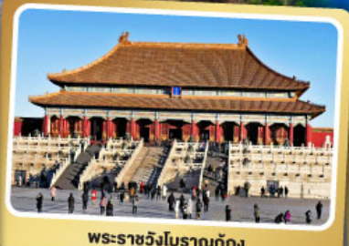
พระราชวังโบราณปักกิ่ง