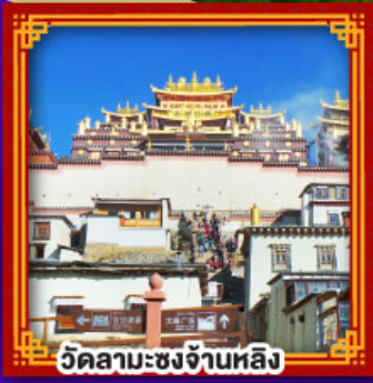
วัดลามะชงจันหลิ่ง