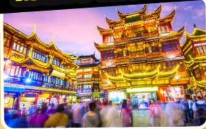
ตลาดร้อยปีเจิ้งหวังเหมียว