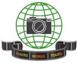
PHOTO WORLD TOURS