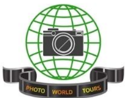
PHOTO WORLD TOURS