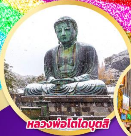
หลวงพ่อโตโคบูตสึ