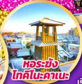
หอรบั้งโทคิโนะคานะ