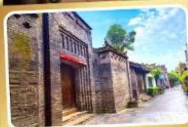
ถนนคนเดินชอยกว้างชอยแคบ