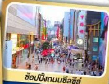
ช้อปปิ้งถนนซื่อลู่