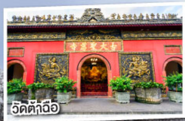
วัดต้าถื่อ