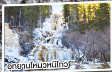
อุทยานโหมวหนี่โกว