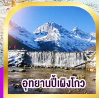
อุทยานป่าเผิงโกว