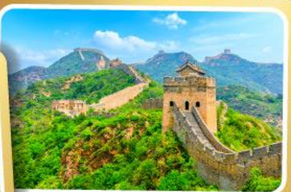
กำแพงเมืองจีน