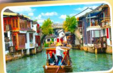
ล่องเรือเมืองโบราณซูเจียเจียว