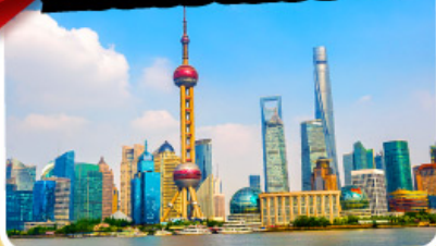
หอไข่มุก