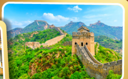
กำแพงเมืองจีน