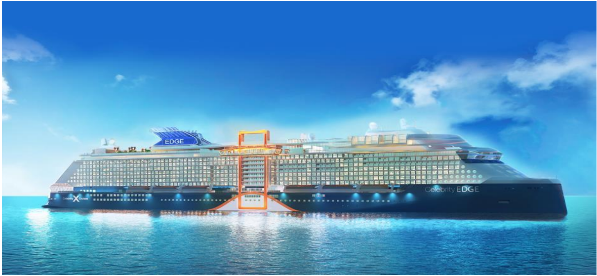
“ Celebrity Egde “