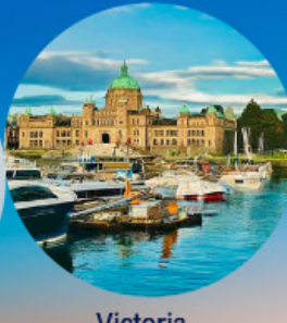
Victoria, British Columbia (Canada)