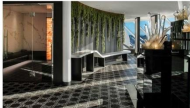
SEA Thermal Suite

Enjoy dining in this exclusive restaurant, featuring inventive dishes crafted by our Michelin-starred chef.