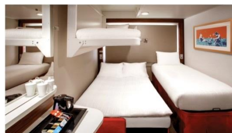
พัก 3-4 ท่าน