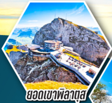
ยอดเขาพิลาตัส