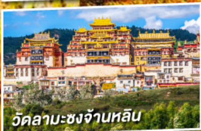
วัดลามะซงจ้านหลิน