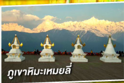
ภูเขาหิมะเหมยลี่