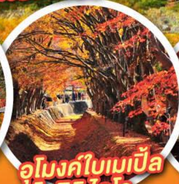
อุโมงค์ใบเมเปิ้ล โมมิจิ ไคโร