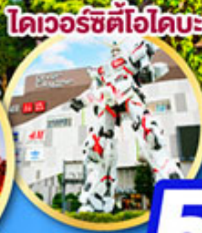
โดเวอร์ซิตีโอโดบะ